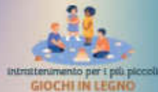
Intrattenimento per i più piccoli GIOCHI IN LEGNO

Un'occasione per vivere un'esperienza musicale unica. Un'occasione per vivere un'esperienza musicale unica.