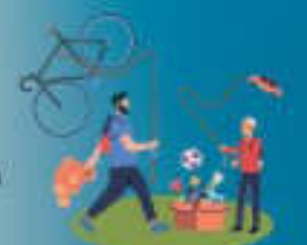
PESCA DI BENEFICENZA